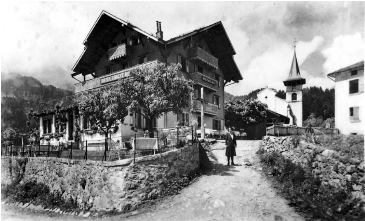
L'hôtel—pension Rosa, l'église et la maison de commune (école, poste) dans les années 1930